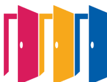
ロータリーは機会の扉を開く