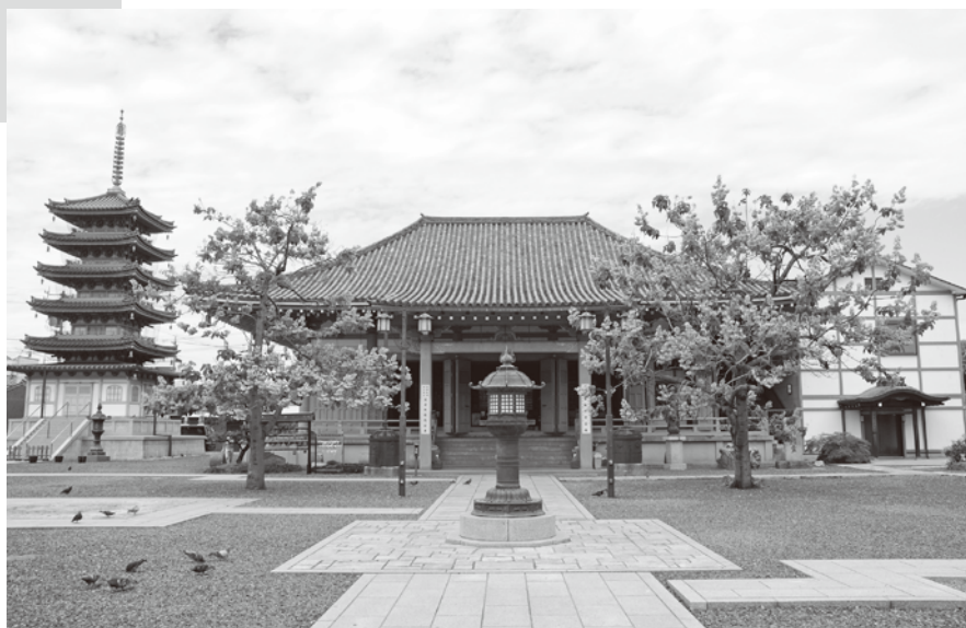
▲写真提供 / 恵日山 観音寺・別格本山 大宝院