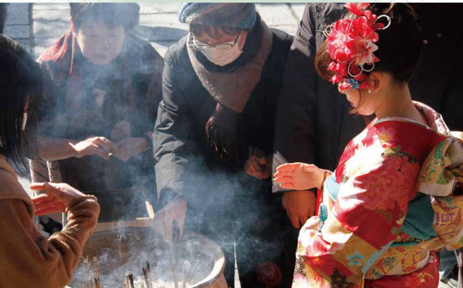
津市 恵日山 観音寺・別格本山 大宝院(津観音)