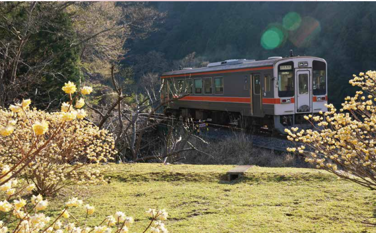
津市南西部を走るJR名松線