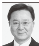
米山記念奨学委員会 委員長

これからもより多くのクラブに補助金を利用して頂けるように、さらに手続きを簡素化し分かり易くしていき、補助金を一度も利用したことがないクラブを無くしていきます。補助金を利用する上で不明な点があれば、いつでも委員会にご相談ください。一年間、ご支援有難うございました。