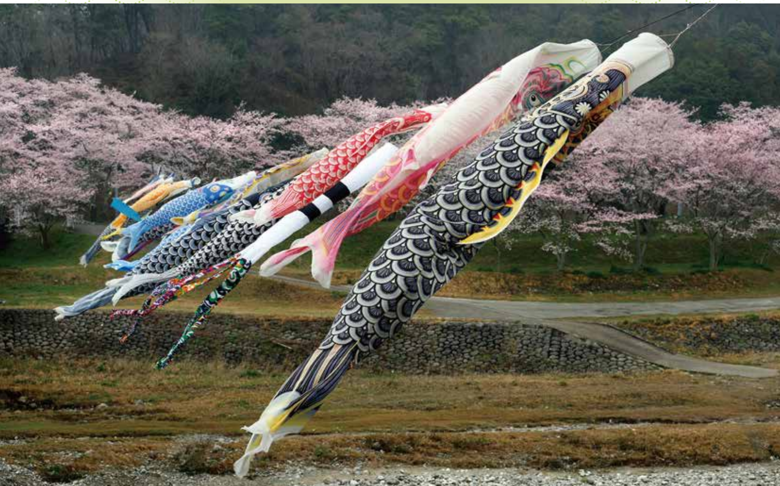
津市白山町 亀ヶ丘「雲出川に泳ぐ鯉のぼり」