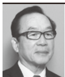
補助金小委員会 委員長

私も資金管理小委員長を3年間させて頂いて、皆様との素晴らしい出会いと地区ロータリー財団の勉強が出来ましたことに感謝申し上げます。有難う御座いました。