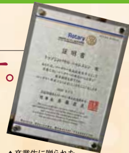
▲卒業生に贈られた 終了証明書