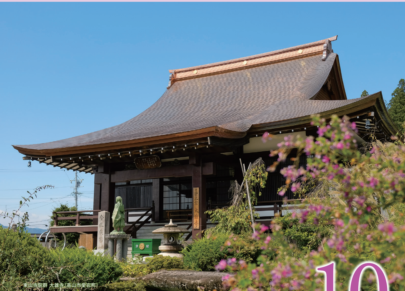
東山寺院群 大雄寺(高山市愛宕町)

TEL 0577-33-2630 FAX 0577-36-1488 URL https://www.rid2630.jp/ E-mail 2021@rid2630.jp