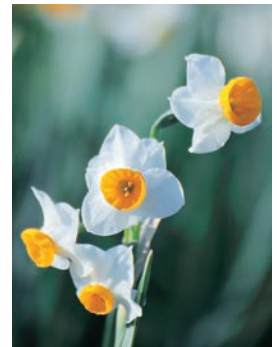
越前水仙(えちぜんすいせん)

日本水仙は冬に咲く花で、正月の生け花によく用いられる。 花市場に福井越前から水仙の入荷が始まってきた。サイズ表示が面白い、普通は2L.L.M.Sだが、ここのは「え」「ち」「ぜ」「ん」。ちょっと洒落ている。 年の瀬、日本海の寒風に揉まれながら咲き始める越前水仙は、他の産地の水仙に比べ、花がひきしまり香りが強い、立ち姿が良い。雪が積もっても折れず、のし掛かっても起き上がる。12月~1月頃、群生開花し越前海岸の至る所で甘い香りと潮風が共にハーモニーを奏でやがての春を告げる。